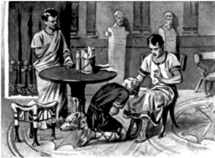
...ZACHWAŁ SIĘ, POTEM RUNĄŁ DO STÓP PATRYCJUSZA.